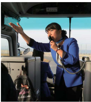
楽しく解説してくれるガイドさん