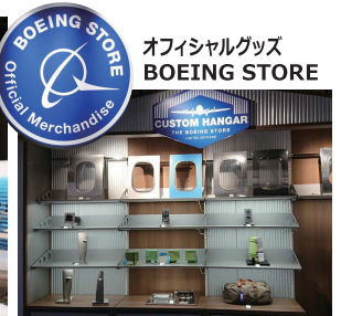
飛行機の部品がズラリ