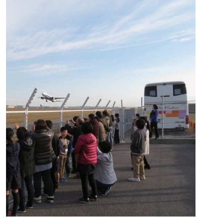
バスから降りて臨場感を味わう降車ポイント