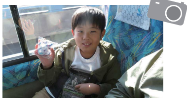
宇宙食をGetしてスマイル!

セントレアに向かう車中では、ジュピターテレコムの中川さんによる「クイズ大会」を開催。正解したお子様には、嬉しいプレゼントが♪ 賞品はディスカバリーチャンネルらしく、なんと『宇宙食!!』とても嬉しそうに受け取ってくれました。一体どんな食感、味なのでしょう?とても気になります…。