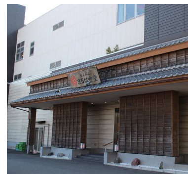
ジャンボエビフライといえば「まるは食堂」