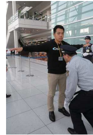
スタッフも緊張の面持ちで 😊